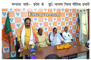
मण्डला यशो:- प्रदेश के हुं। भाजपा जिला मीडिया प्रभारी

मु. यमत्रि के आगमन की तैयारी को लेकर भाजपा की बैठक आयोजित