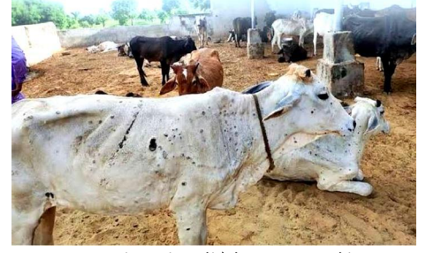
अतिरिक्त, बोवर्ची-2 संक्रमण से जुड़े घाव अधिक सतही होते हैं। बोवर्ची-2 का कोर्स भी छेदा है और यह LSD की तुलना में अधिक हल्का है। दो संक्रमणों के बीच अंतर करने के लिए इसे टीन माइक्रोस्कोपी का उपयोग किया जा सकता है।