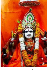
विश्रामन है। श्रीविद्या के सिद्धिद्वै 1997 वैशाख शुक्ल दसमीं को अपने कर कर्मों से मातृधाम में श्रीमता ललितेश्वरी त्रिपुर सुंदरी का प्राण-प्रतिष्ठ कर 'ना मातृ पदोत्सव' के का दिव्य संदिग्ध। आज वही स्थान सनातन धर्मों के लिए महान अस्थानों के शिखरों का महान केंद्र है।