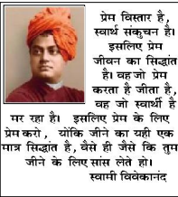
प्रेम विलास है, स्वार्थ संकल्पन है। इसलिए प्रेम जीवन का सिद्धांत है। वह जो प्रेम करता है जीता है, वह जो स्वार्थी है मर रहा है। इसलिए प्रेम के लिए प्रेम करो, योगी जीन का यही एक मात्र सिद्धांत है, वैसे ही जैसे कि तुम जीने के लिए सांस लेते हो। स्वामी विवेकानंद