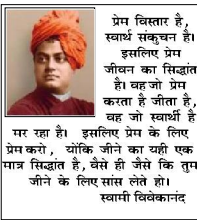
प्रेम विलार है, स्वार्थ संकुचन है। इसलिए प्रेम जीवन का सिद्धांत है। वह जो प्रेम करता है जीता है, वह जो स्वार्थी है मर रहा है। इसलिए प्रेम के लिए प्रेम करो, यौनिक जीवन का यही एक मात्र सिद्धांत है, वैसे ही जैसे कि तुम जीने के लिए सांस लेते हो। स्वामी विवेकानंद