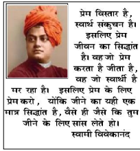
प्रेम विलास है, स्वामी संकल्पन है। इस्लाम प्रेम जीवन का सिद्धांत है। यह जो प्रेम करता है जीता है, यह जो स्वार्थी है मर रहा है। इस्लाम प्रेम के लिए प्रेम करो, यौनिक जीने का यह एक मात्र सिद्धांत है, जैसे ही जैसे कि तुम जीने के लिए सांस लेते हो। स्वामी विवेकानंद