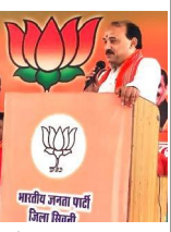
भारतीय जनता पार्टी जिला सितनी