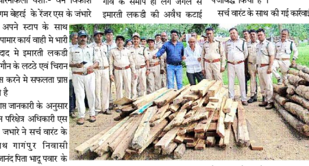
जंगल में सच वाट के साथ गहनदत्त पिता धादु पवार के यहाँ छापामार कार्यवाही कर 29 नग सामान के लट्टे 13 नग बखी के साथ साथ घर के अन्दर से भारी मात्रा 144 नग चिरान जप्त करने की प्रभावी कार्यवाही की है। वन विभाग द्वारा गांगपुर में की अश्वीय रूप से इमारती लकड़ी का कारोबार करने वाले के विरुद्ध की है और उसे हार डोड़ कार्यवाही से क्षेत्र के वनमाफिया यार्डों में खलबली मची हुई है।