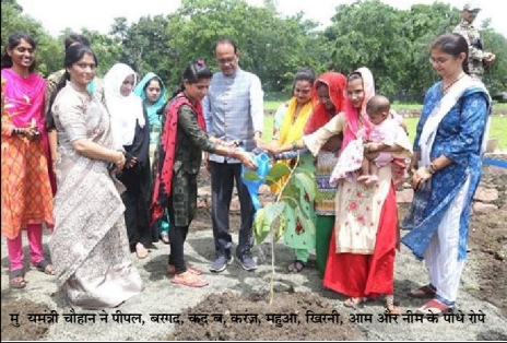
मु यमत्री चौहान ने पीपल, बरगद, कड़व, करंज, महुआ, खिलनी, आम और नीम के पौधे रोपे