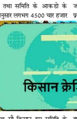
पाच सौ किसान इस समिति के सदस्य है तथा प्रति वर्ष लगभग 900 नई से किसान समिति से खाद बीज के तौर पर जग लेते है किन्तु समिति से जुडे किसानों को अपने कृषि कार्य के नगद जग की सुविधा यहा से नहीं मिल रही है जब इस स चय में किसानों से बात की गई तो उनका कहना है हमे खाद तो कृषि जग के तौर पर दिया जा रहा है किन्तु नगद जग की सुविधा नहीं है कलहर वायास कर दिया जाता है इस कारण इस छेव के किसानों को तीन वर्ष नगद जग के रूप में जग नहीं मिल रहा है