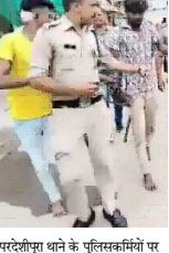
परदेशीपुर धाने के पुलिसकर्मियों पर

25 जुलाई से आरंभ होगी 5 यात्राएँ मु यमत्री श्री चौहान ने कहा कि प्रदेश में 25 जुलाई से 5 यात्राएँ आरंभ होंगी। यह सभी यात्राएँ अलग-अलग गाँव से गाँव की मटी