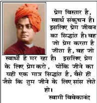
प्रम विस्तार है, स्वार्थ संकुचन है। इसलिए प्रम जीवन का सिद्धांत है। वह जो प्रम करता है जीता है, वह जो स्वार्थी है परा होता है। इसलिए प्रम के लिए प्रम करो, योक्ति जीने का यही एक मात्र सिद्धांत है, जैसे ही जैसे कि तुम जीने के लिए सारा लेते हो। स्वामी विवेकानंद