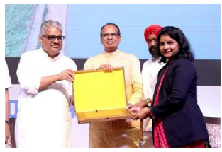
गौ-काष्ठ, अपशिष्ट प्रबंधन, कार्बन कैप्चर, प्रदूषण नियंत्रण के उपाय, प्लास्टिक अपशिष्ट प्रबंधन, लीन एयर प्रोजे 2, सेलुलर कियोस्क, सोपेट ड्रॉपिंग में प्रदूषण नियंत्रण, ऑटि पर केंद्र प्रदूषण का फेन कट कर उखाड़ना किया। प्रकृति और पर्यावरण सत्रेण भारत की मार्टी में है। मु यमंत्रि श्री चौहान ने राष्ट्रीय कार्यक्रम को संबोधित करते हुए कहा कि प्रकृति को रक्षित करने से हमें भारत की मार्टी में है। भारतीय संस्कृति की मान्यता है कि प्रकृति का शोभा नहीं

शहरों को मिले डेढ़ करोड़ से लेकर 12.50 लाख रुपये तक के पुरस्कार राष्ट्रीय कार्यक्रम में 10 लाख से अधिक जनसं या वाले शहरों को श्रेणी में आया को एक करोड़ रुपये का इतिवैय और ठाणे (महाराष्ट्र) को 50 लाख रुपये का तुमिप और तीन से दस लाख आबादी की श्रेणी में अंतरराष्ट्रीय को 75 लाख रुपये का प्रथम, मुद्रुदबद को 50 लाख रुपये का इतिवैय, मुद्रु को 25 लाख रुपये का तुमिप और तीन से दस लाख से कम आबादी की श्रेणी में खलियार प्रदेश के परल्लु को 37.50 लाख का प्रथम