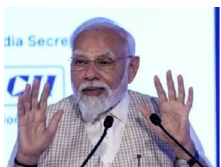
प्रधानमंत्री नरेंद्र मोदी के जन्मदिन पर विधानसभा दो और तीन में ऐतिहासिक स्वास्थ्य परीक्षण और आयोग कार्यक्रम और शिविर का आयोजन किया जाएगा. प्रधानमंत्री नरेंद्र मोदी के जन्मदिन पर विधानसभा दो और तीन में ऐतिहासिक स्वास्थ्य परीक्षण, उपचार कार्यक्रम और शिविर का आयोजन किया जाएगा. उन्होंने कहा कि उनके साथ लगभग 1000 डॉ. टर, पैर

इंदौर । प्रथममंत्री मोदी के जन्मदिन पर विधानसभा दो और तीन से ऐतिहासिक पहल की जा रही है. यानि इन दृष्टि स्वच्छता के बाद स्वास्थ्य की राजधानी बनेगा. बीजेपी के महासचिव कैलाश विजयवर्गीय के मार्गदर्शन में स्वास्थ्य इंदौर को शुरुआत होगी. विधानसभा क्षेत्र दो और तीन के बीजेपी कार्यकर्ता स्वास्थ्य दूत बन रहे हैं. जहां दोनों विधानसभा क्षेत्रों के हर घर के हर सदस्य की स्वास्थ्य क्यूटीली भी बनेगी. इस विज्ञानांतर शिविर में एलपीबी, हो चोपैथी, आर्युवेद, सिद्ध दूननी और प्राकृतिक चिकित्सा और योग से निष्कूल इलाज विषय वि यात विशेषज्ञ डॉ. रमेश चंद्र यादव रहे हैं. जिसमें 154 तरह की वस्तु की जांचें, निष्कूल इलाज और सर्जरी की जाएगी. स्वच्छता के क्षेत्र में देश में अपनी पहचान बनाने वाला इंदौर अब जनस्वास्थ्य के क्षेत्र में भी मिशनर बनकर उभरेगा. जन स्वास्थ्य