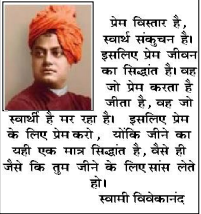
प्रेम विस्तार है, स्वार्थ संकुचन है। इसलिए प्रेम जीवन का सिखाता है। यह जो प्रेम करता है जीता है, यह जो स्वार्थी है परा होता है। इसलिए प्रेम के लिए प्रेम करो, योगिक जीने का यही एक मात्र सिखाता है, जैसे ही जैसे कि तुम जीने के लिए सांस लेते हो। स्वामी विवेकानंद