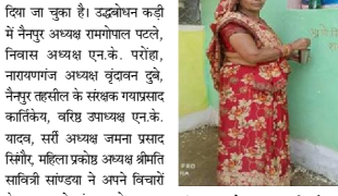
मंडला यशो- भारत निर्वाचन आयोग ने विधानसभा आम