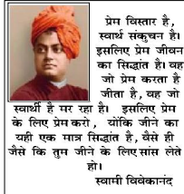
प्रेम विस्तार है, स्वार्थ संकुचन है। इसलिए प्रेम जीवन का सिद्धांत है। वह जो प्रेम करता है जीता है, वह जो स्वार्थी है पर रहा है। इसलिए प्रेम के लिए प्रेम करो, सोचो जीने का वही एक मात्र सिद्धांत है, जैसे कि जैसे कि तुम जीने के लिए सास लोते हो। स्वामी विवेकानंद