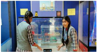
केन्द्रीय विद्यालय के कक्षा 10वीं और 12वीं के विद्यार्थियों का परिचालक शैक्षणिक भ्रमण काया गया।

केन्द्रीय विद्यालय के कक्षा 10वीं और 12वीं के विद्यार्थियों ने साइंस सेंटर का किराया शैक्षणिक भ्रमण कराया गया।