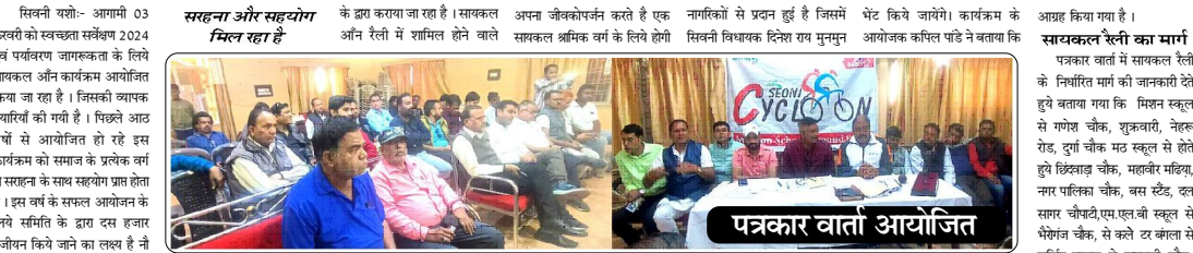
प्रक्रार वार्ता आयोजित

स्वच्छता सर्वेक्षण के तहत सायकल आँन का भव्य आयोजन 03 फरवरी को