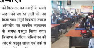
मंडला यशो:- माननीय न्यायालय द्वारा भारत आदेश के अनुसार 1 अक्टूबर 2019 के पूर्व पंजीकृत वाहनों पर हाईसि यूनिटी रजिस्ट्रेशन प्लेट लागू करने के संबंध में 30 जनवरी 2024 को जिला परिवहन कार्यालय मण्डला द्वारा रानी दुर्गावती शासकीय खातकोर महाविद्यालय मण्डला में शिविर का आयोजन किया गया। शिविर में हाईसि यूनिटी रजिस्ट्रेशन प्लेट की ऑनलाइन बुकिंग एवं एचएसआरपी लायनेरी की पूरी प्रक्रिया समझाई गई। शिविर में समस्त वाहनों में एचएसआरपी अनिवार्यतः लगाए जाने हेतु अनुरोध किया गया एवं बिना हाईसि यूनिटी रजिस्ट्रेशन प्लेट लेने वाहन चलाने पाये जाने पर जानौनी एवं दण्डात्मक कार्यवाही होने के संबंध में भी बताया गया। शिविर में 23 वाहनों की हाईसि यूनिटी रजिस्ट्रेशन प्लेट ऑनलाइन बुक की गई। शिविर में महाविद्यालय के प्राचार्य, स्टाफ, छात्र-छात्राएं एवं जिला परिवहन कार्यालय का स्टाफ उपस्थित रहा।