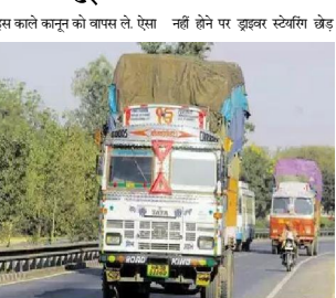
इस काले कानून को वापस ले, ऐसा नहीं होने पर ड्राइवर स्ट्राइक छोड़ देंगे

सिवनी यशो- मध्य प्रदेश में नए हित एंड रन कानून के खिलाफ ड्राइवर सड़क पर उतर आते हैं। ड्राइवरों की युक्तिम ने इस कानून का विरोध किया है। उन्होंने बताया कि कैसे ये कानून उनके लिए संकट बन जाएगा।