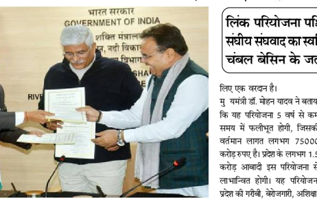
प्रथामंत्री श्री नरेन्द्र मोदी के नेतृत्व में लगभग दो हफ्ते से चलित पार्वती-कालीसिंध-चंबल परियोजना अब मूर्त रूप ले सकेगी। इस परियोजना से मध्यप्रदेश के चंबल और मालवा अंचल के 13 जिलों को लाभ पहुंचेगा। प्रयां के झूंड केत