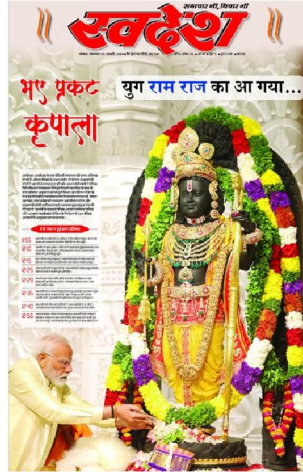
मौन साक्षरक तपस्या कर रही थी, जिन्के दर्शन के लिए भारत के सुदूर छोर से लोग पैदल ही अयोध्या आए चले आ रहे हों, जिनके प्रथम दर्शन