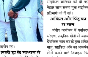
शिक्षक, एक साइकिल व्यापारी, एक साइकिल श्रमिक, एक साइकिल फिट मीडिया व एक साइकिल इले ट्रान्जिक मीडिया को दी गई। साथ ही एनपीसी व स्वास्ट में 1 साइकिल बालक तथा एक साइकिल बालिका को दी गई। बेहतर साज सज्जा युक्त साइकिल प्रतिभागी को दी गई।