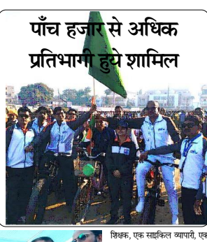
पाँच हजार से अधिक प्रतिभागी हुये शामिल