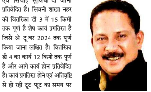
खवासा चैक पोस्ट में कोई अवैध वसूली नहीं होती - परिवहन मंत्री