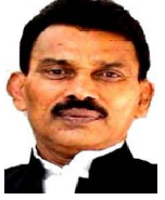
सिवनी का नहर सुधार कर सिंचाई सुविधा दी जायेगी

सिवनी विधानसभा के जनप्रतिनिधियों एवं कुशकों द्वारा परियोजना का विस्तार कर मांग किये गये ग्राम कलारवांकी, बजरवाडा, देवरी, भाजीपानी, लुंगसा, जोगीवाडा आदि विभिन्न ग्रामों के प्रगतिरत कार्यों को पूर्ण करने एवं सिंचाई की मांग की गयी है तथा मांग अनुसार निर्माण कार्य प्रगतिरत होना प्रतिबद्धित है।