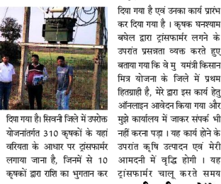
कि कृषक द्वारा इस कार्य हेतु प्रकृतन राशि की मात्र 50 प्रतिशत राशि का भुगतान किये जाने पर मु यमत्री किसान मित्र योजना के अंतर्गत प्रथम ट्रांसफार्म लगा कर चालू कर दिया गया है। सिवनी जिले में उसीक योजनांतर्गत 310 कृषकों के यहां कार्यवाही के आगार पर ट्रांसफार्म लागू आने में वृद्धि होगी। यह ट्रांसफार्म चालू करते समय