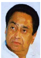
रहने की बाजनाजी करते रहे। कमलनाथ के भाजपा में शामिल होने की अटकलों को उस समय और बल मिल गया जब उनके बेटे सांसद नकुलनाथ ने सोशल मीडिया प्लेटफॉर्म ए पर अपनी भावों से कांग्रेस को टटा दिया था। यही नहीं कमलनाथ अपने सभी कार्यक्रमों को रद्द कर बेटे नकुलनाथ के साथ राजधानी दिल्ली पहुंच गए थे। यहां उन्होंने मीडिया के साथ बातचीत में बीजेपी में जाने की संभावनाओं से इनकार नहीं किया था। इस दौरान उन्होंने केवल इतना ही कहा था कि वे भाजपा में जाने की संभावनाओं से इनकार नहीं करते हैं, जो कई बार प्रतीत होता है कि कमलनाथ कांग्रेस के निर्णयों को विपरीत है। कांग्रेस

सिवनी यशो- मध्य प्रदेश के पूर्व मु यमत्री कमलनाथ ने हाल ही में कांग्रेस की सदस्यता से इस्तीफा दे दिया था और उसके बाद मीडिया में तेजी से यह खबर चलने लगी थी कि कमलनाथ बीजेपी में अपने सांसद पुत्र नकुलनाथ एवं अनेक विधायकों के साथ शामिल हो रहे हैं। शनिवार को दिन भर अटकलें बाँझनी चलती रही फिर खबर को भी इसी प्रकार की अटकलें चलते रही। कमलनाथ के बहुत करीबी नेताओं ने अति उत्साह में अनेक तरह की बयानबाजी कर दी और कांग्रेस के बहिष्कृत नेताओं को कोसना भी प्रारंभ कर दिया। कांग्रेस में कमलनाथ समर्थक नेताओं ने सोशल मीडिया एकांठ की डीपी बल्लू दी कमलनाथ सहित अनेक नेताओं के यहाँ भाग्य झूट लहाने लगे परंतु कमलनाथ ने चल रही अटकलों का कोई जवाब नहीं दिया। यहाँ तक की कमलनाथ के बहुत करीबी माने जाने वाले सज्जन सिंह यमनी ने भी अपने प्रतिक्रिया बयान में कहा कि जहाँ कमलनाथ रहे वहाँ हम रहेंगे और उनका सीधा अर्थ था कि कमलनाथ यदि भाजपा में जा रहे हैं तो वे भी उनके साथ भाजपा ज्वाइन करेंगे। छिंटवारा