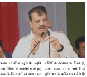
प्रवास पर देवीया पहुंचे थे। उन्होंने यहां मॉडिया से बातचीत करते हुए कहा कि जिस पार्टी का अयाध 40

उन्होंने कहा कि अब जनता ब्रुट से चम चुकी है और चार बूट को फैसला सामने आ जाएगा। सिंघार ने कहा कि इस बार प्रदेश में कांग्रेस अग्रिम विधायक प्रदर्शन करेगी। उन्होंने प्रदेश की आगामी सीटों पर कांग्रेस का ज़ब लंबे समय का दावा किया है।